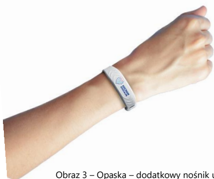
Obraz 3 – Opaska – dodatkowy nośnik uprawnień