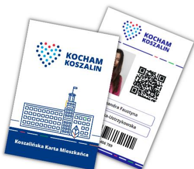
Obraz 1 – wizualizacja awersu i rewersu Koszalińskiej Karty Mieszkańca w formie plastikowej

Dokumentem potwierdzającym posiadanie uprawnień wynikających z uczestnictwa w Programie jest Karta w zindywidualizowanej formie, plastikowa lub elektroniczna, przypisana do konta w Aplikacji Mobilnej. Dodatkowym nośnikiem uprawnień może być Opaska.