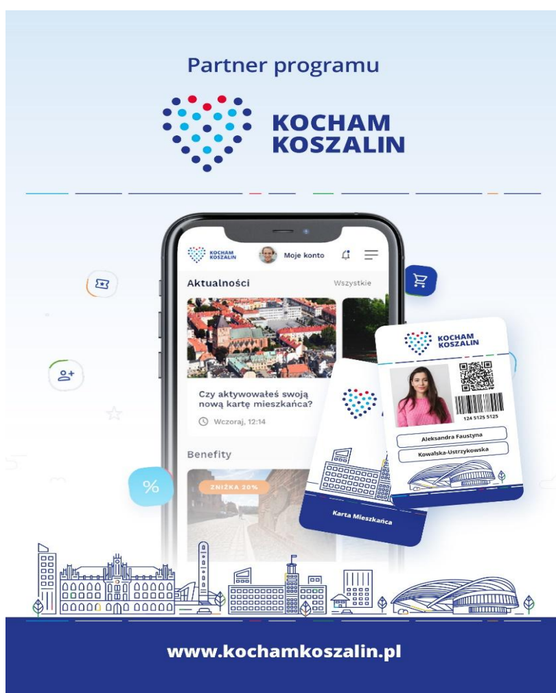
Obraz 5 – naklejka na lokal Partnera

Lokale Partnerów oznaczone są naklejkami zgodnie ze wzorem: