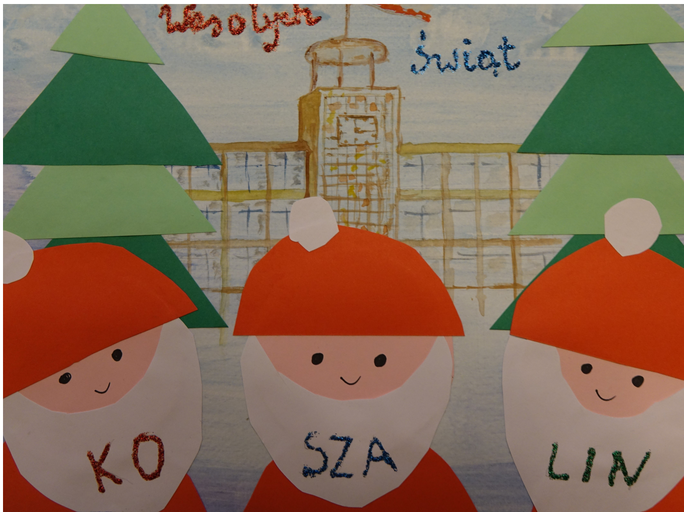
Julia Nowak ze Szkoły Podstawowej nr 17