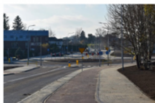
modernizacja rejonu ulic: Chałubińskiego, Leśna, Promykowa, Słoneczna, Karłowicza

wydatki na drogi i infrastrukturę telekomunikacyjną – 64,7 mln zł (w tym inwestycje 41,9 mln zł )