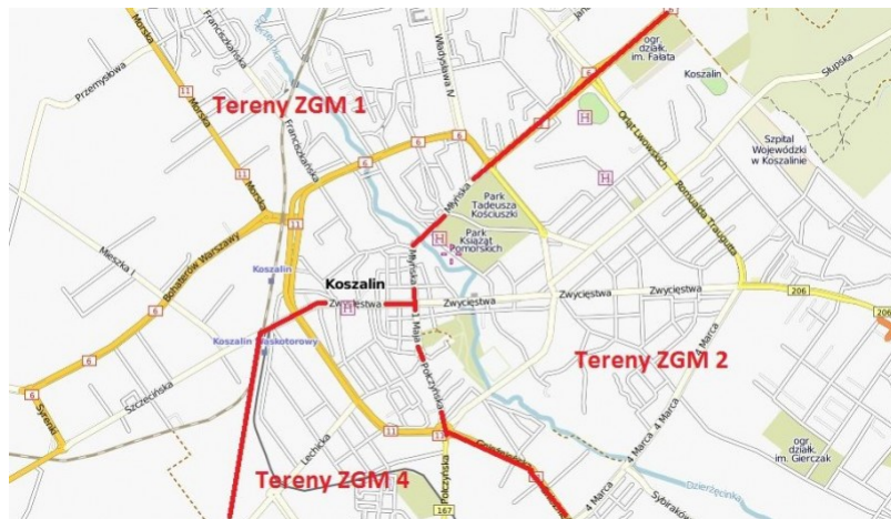
Stary podział ZGM

ZGM nr 1 obejmie swoim działaniem wszystkie budynki i lokale na północ od ul. Zwycięstwa, a ZGM nr 4 na południe.