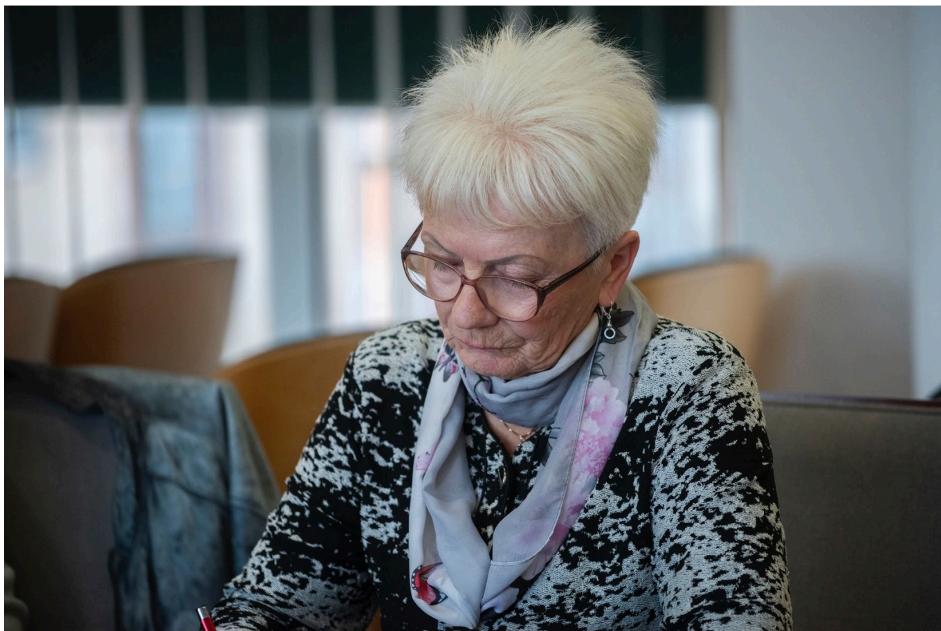
Spotkanie informacyjne z zarządcami nieruchomości w Koszalinie