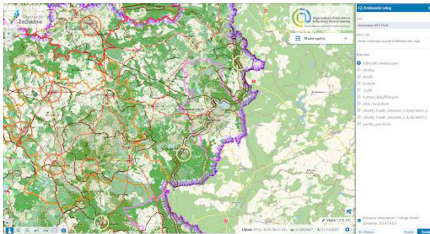
Zdjęcie nr 3 – Podłączenie usługi sieciowej WFS do mapy

Oparcie Portalu RIIP WZ na usługach sieciowych umożliwia różnorodną prezentację graficzną zgromadzonych danych poprzez wygenerowanie warstw, które są w obszarze zainteresowania użytkownika.